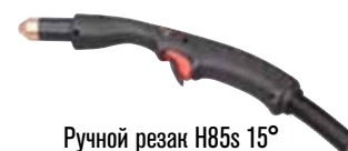
Ручной резак H85s 15°