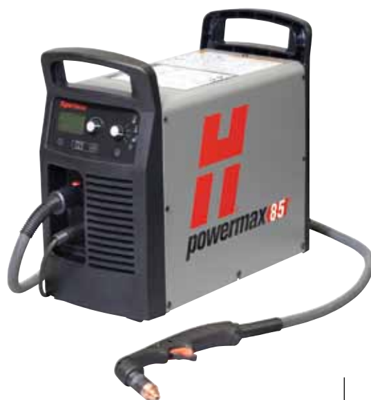
Типы резаков Duramax Ручной резак H85 75°